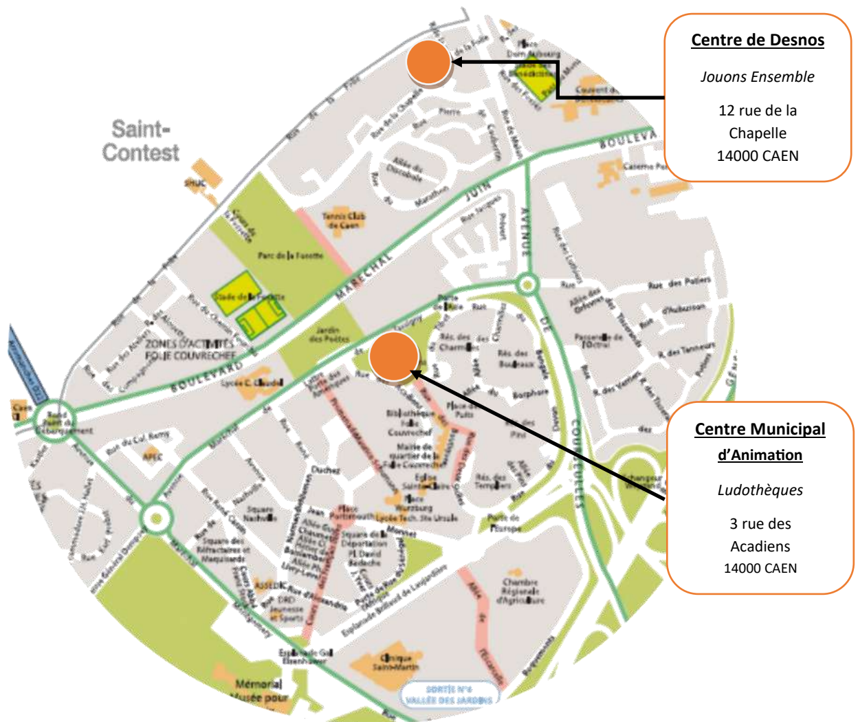
Les Ludothèques et les locaux de Jouons Ensemble sur le quartier de la Folie-Couvrechef

Elles sont en partenariat avec l'association Jouons Ensemble dont les locaux sont situés dans le centre Desnos.